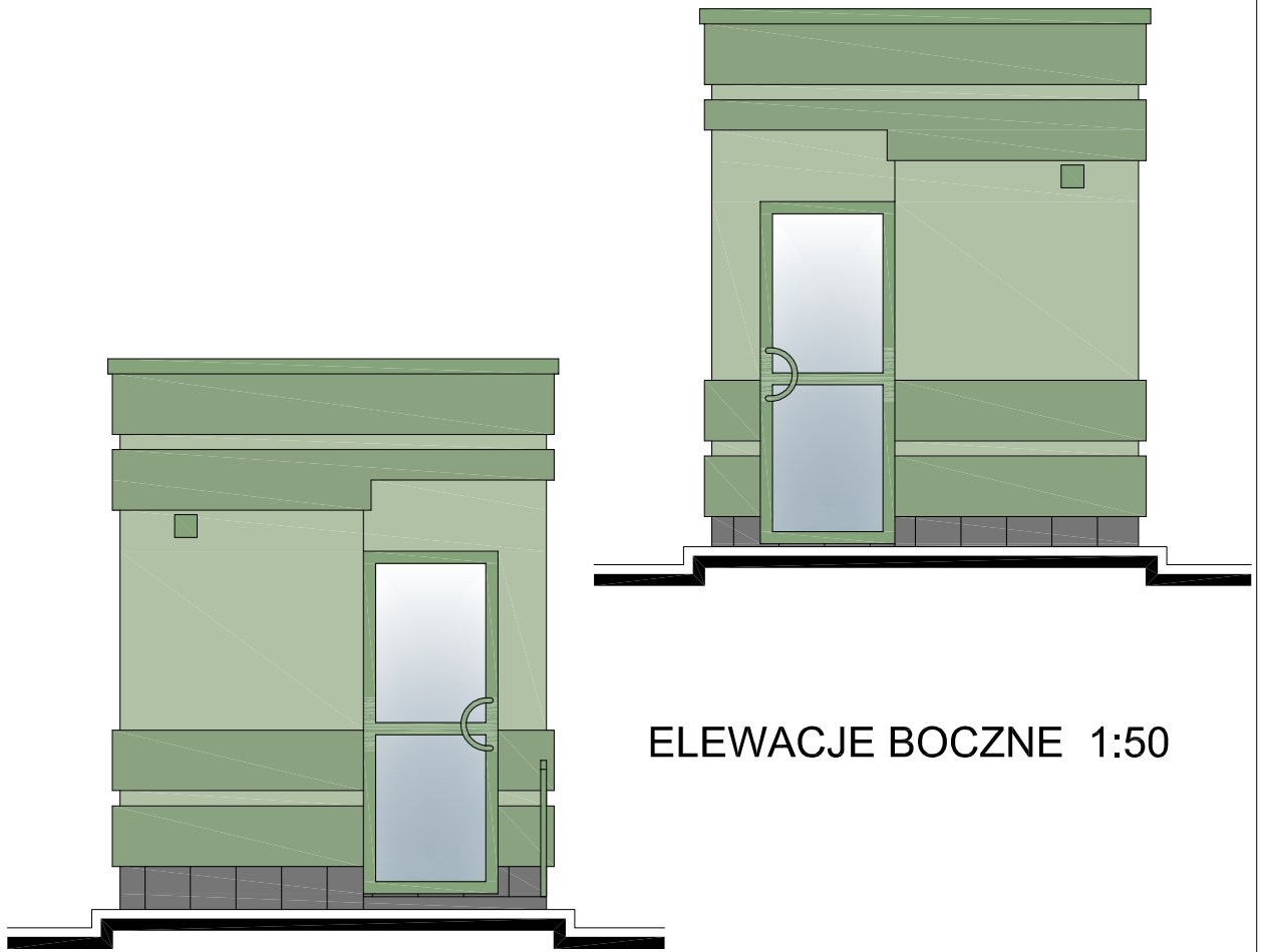
ELEWACJE BOCZNE 1:50