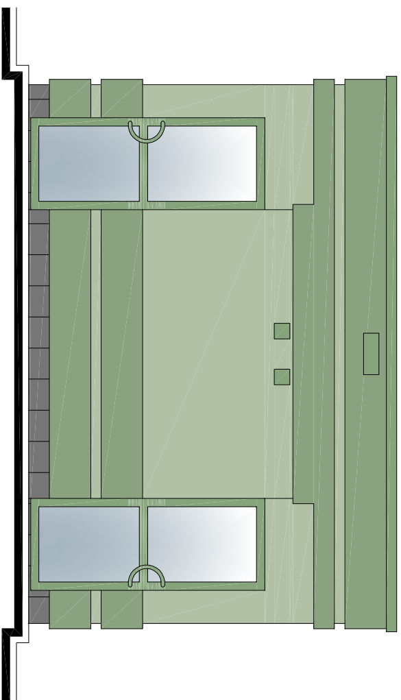
ELEWACJA BOCZNA 1:50