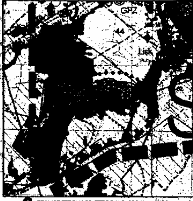
GRANICE TERENU OBJĘTEGO MIEJSKOWYM PLANEM ZAGOSPODAROWANIA PRZESTRZENNEGO

1. Nazwa i adres inwestora: 2. Nazwa i adres wykonawcy: 3. Nazwa i adres projektanta: 4. Nazwa i adres inwestora: 5. Nazwa i adres wykonawcy: 6. Nazwa i adres projektanta: