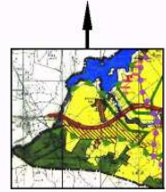
WYRYS ZE STUDIUM UWARUNKOWAŃ I KIERUNKÓW ZAGOSPODAROWANIA PRZESTRZENNEGO GMINY BISKUPIEC