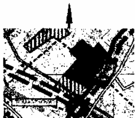
Wzrys ze Studium Uwarunkowań i Kierunków Zagospodarowania Przestrzennego Gminy Stawiguda